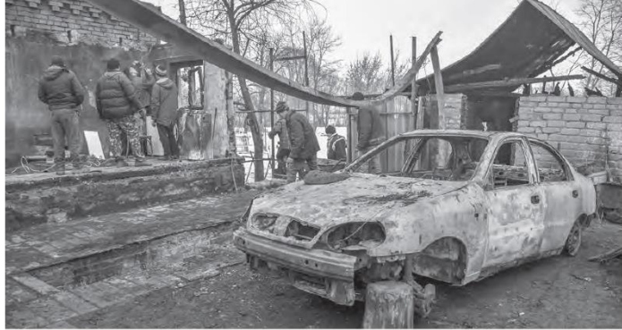
ПОГОРІЛЬЦІ. Полум'я знищило не лише дах будинку та господарські будівлі, а й чужу автівку

Пожежа сталася у Глухові опівдні 21 грудня по вулиці Дорошенків. Полум'я за лічені хвилини встигло знищити сарай, літти до гаража та охопити дах будинку. Дочка згоріла прибулова, у якій стояли котені,